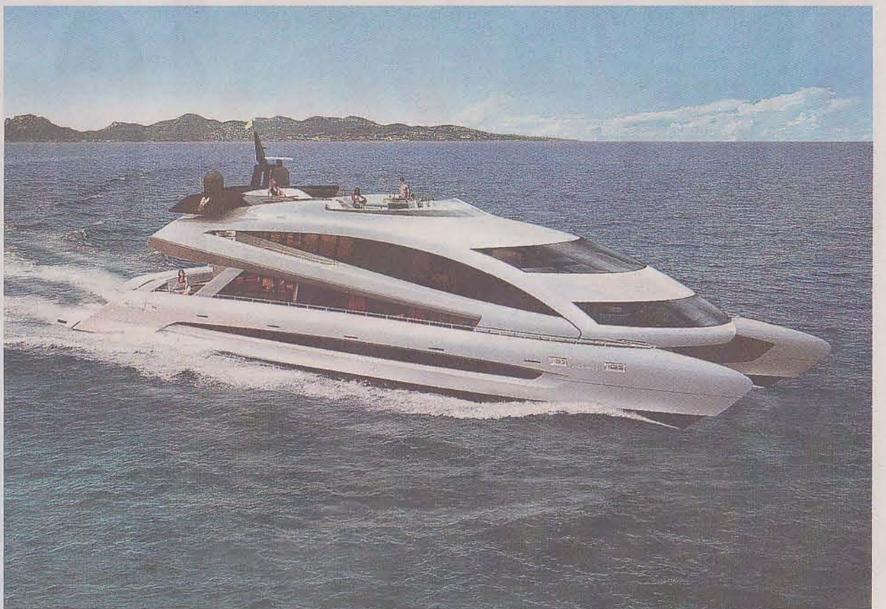
Så här kommer lyxyachten RFF 135 som byggs på Muskö att se ut när den är klar.