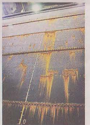
RFF 135 byggs i en av dockorna i den gamla örlogsbasen på Muskö.