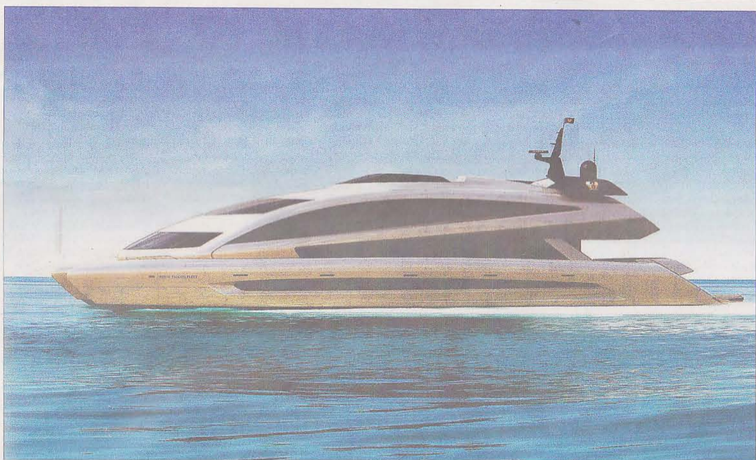
Porschedesign i sin prydo. Ja, så kan man kanske beskriva den lyxyacht som ska färdigställas i en av dockorna i Musköberget.