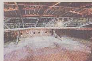
Härifrån kommer kaptenen att styra båten.