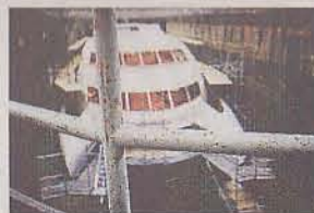
Yachten väntas kunna köra i 35 knop när den är klar.