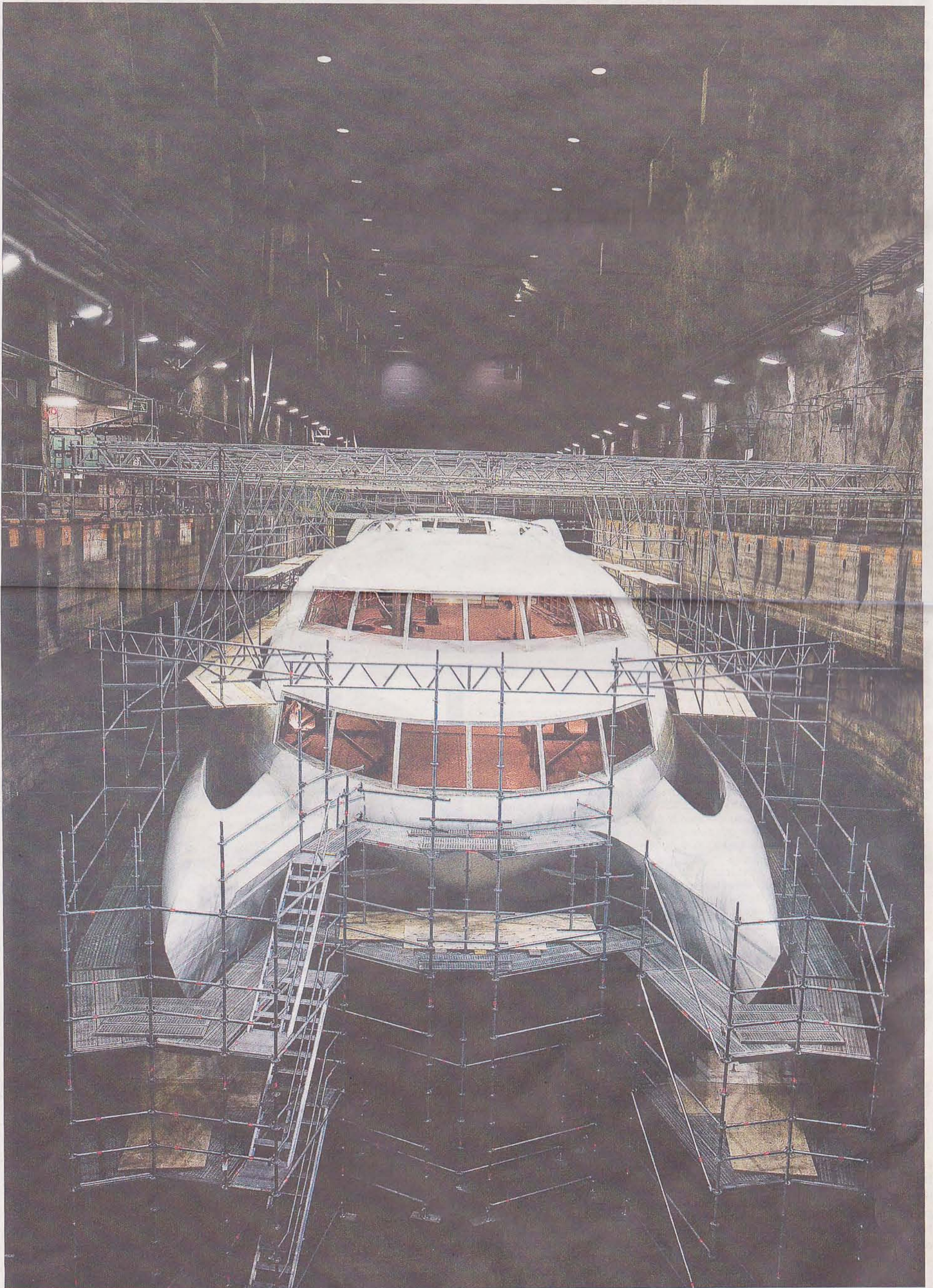
Royal Falcon Fleet bygger en lyxyacht i Musköberget.